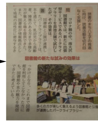
八王子市内のパークライブラリー